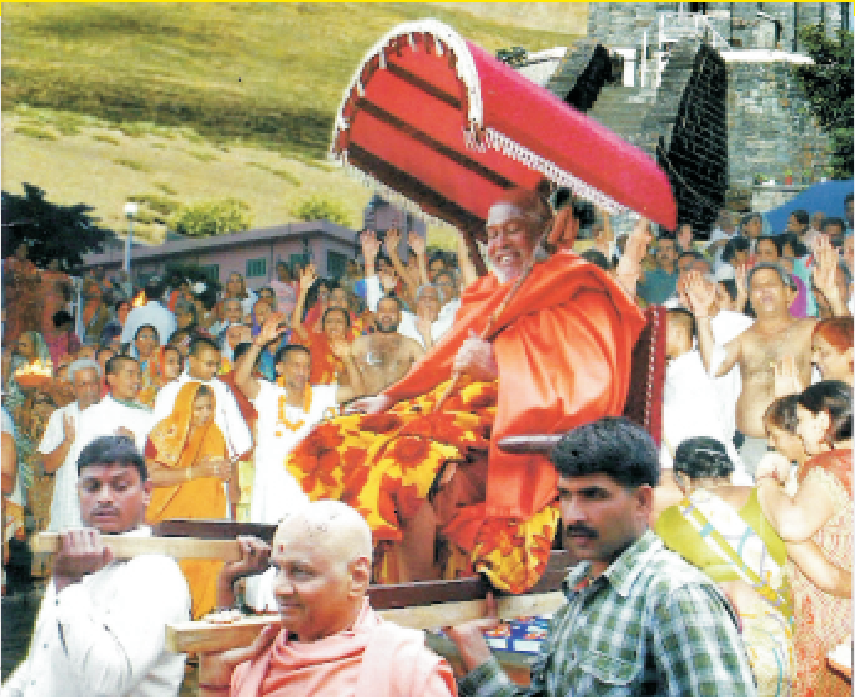
Swagatham to Jagatguru at Pune Yathimalayam conducted at Mathura on 12th October 2012.